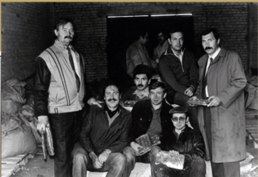
Участники операции "Дипломат" – сотрудники Управления по борьбе с контрабандой ГУГТК. Три с половиной тонны гашиша было изъято из обращения международной мафии контрабандистов в результате совместной операции советской и британской таможенных служб.