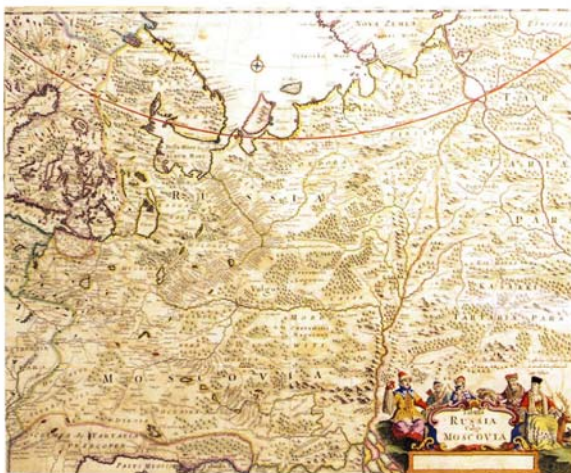
Ф. де Витт. Карта России. Около 1670 г. С обозначением северного Двинского торгового пути

приговором «О взимании таможенной пошлины с товаров в Москве и в городах с показанием поскольку взято и с каких товаров» от 25 октября 1653 года.