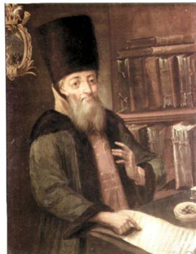
Афанасий Лаврентьевич Ордын-Нащокин. 1607–1680 гг. Руководитель приказов Посольского и Большой Казны