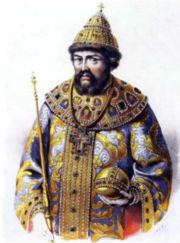
Царь Алексей Михайлович. 1645–1676 гг.

В царствование Алексея Михайловича Романова (1645–1676) завершилось становление