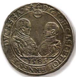
Талер. Саксония. 1585 г. Использовался как монетное серебро для изготовления русских денег