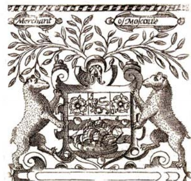
Герб Московской компании. 1596 г.