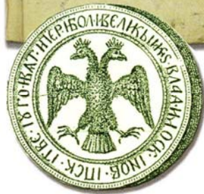
Оттиск печати царя Иоанна IV Васильевича. 1571 г.