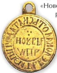
Печать Белоколотской таможи. XVII в.

По инициативе выдающегося реформатора, боярина, воеводы, известного дипломата А. Л. Ордын-Нащокина, отстаивавшего интересы российской торговли, в 1667 году был подготовлен и издан Посольским приказом «Новоторговый устав». Документ запрещал розничную торговлю для западноевропейских купцов, отменял мелкие торговые пошлины, подтверждал исчисление таможенных пошлин с рубля. Еще в Указе от 25 октября 1653 года была установлена норма исчисления тамги в размере 10 денг с рубля с продажной цены товара. Эта норма не касалась оставшихся в силе торговых сборов, мытных, амбарных и перекупных пошлин. В условиях денежной реформы и с учетом результатов «медного» бунта 1654 года для облегчения торговых отношений с Западной Европой был установлен обменный денежный курс для уплаты пошлин иностранцами. Торгующие в России иноземцы вносили пошлины серебряными ефимками (дукатами и талерами). Новоторговый устав подтвердил и уточнил установившиеся в предшествующую эпоху правила досмотра, явки и опечатывания товаров. В XVII веке существовало большое количество разнообразных таможенных пошлин и мелочных сборов. Таможенными сборами ведали более 70 приказов. С 1680 года сбор основных таможенных и торговых налогов был сосредоточен в Приказе Большого Прихода, объединенного с Приказом Большой Казны.