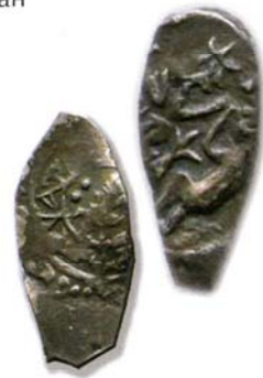
Контрабандные «Воровские денги». XVII в. Доставлялись через Архангельск и Прибалтику