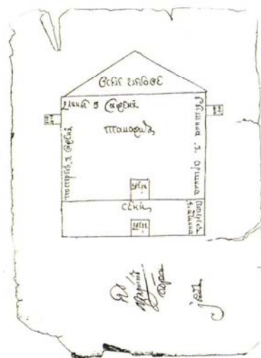
Чертеж-схема таможенной избы. XVII в.