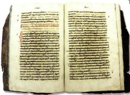
Соборное Уложение. 1649 г.

в мытной сфере, права крупных вотчинников и землевладельцев ограничиваются. Документ определил роль таможенников, мытников, перевозчиков и мостовщиков по осуществлению контроля за перевозом товаров, перемещением иностранцев и государевых служилых людей.