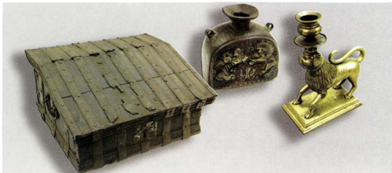
Предметы интерьера таможенной избы XVI–XVII вв.: сундук-подоловок, чернильница, шандан