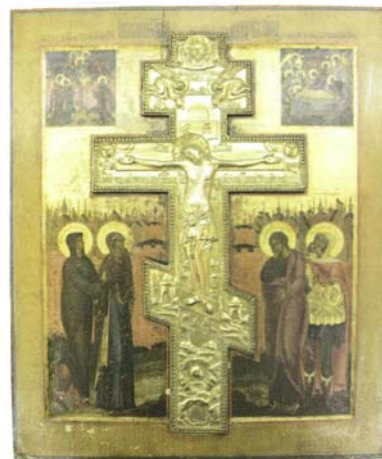
Крестоцеловальная икона. Расятие с предстоящими. Начало XIX в.