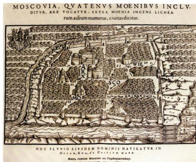
С. Герберштейн. План Москвы. 1556 г.