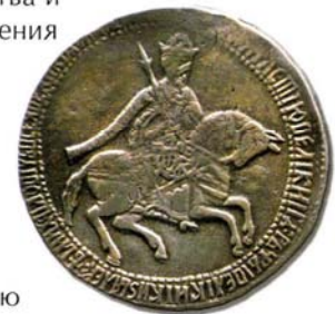
Рубль. Царь Алексей Михайлович. 1654 г.

в мытной сфере, права крупных вотчинников и землевладельцев ограничиваются. Документ определил роль таможенников, мытников, перевозчиков и мостовщиков по осуществлению контроля за перевозом товаров, перемещением иностранцев и государевых служилых людей.