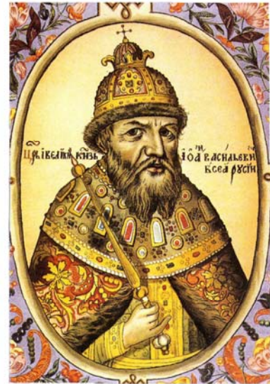
Царь Иоанн IV Васильевич. 1547–1584 гг.

Таможенные пошлины в этот период составляли для вывозной и ввозной торговли не более 3% от стоимости товара в «московских рублях».