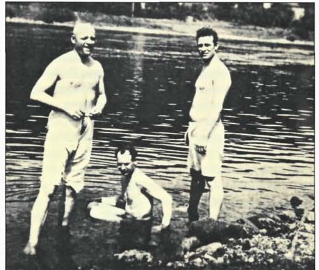
Купание на Эльбе. Май 1945 г.

Имеет боевые награды: три ордена Красного Знамени, три ордена Красной Звезды, орден Отечественной войны II степени и многие другие.