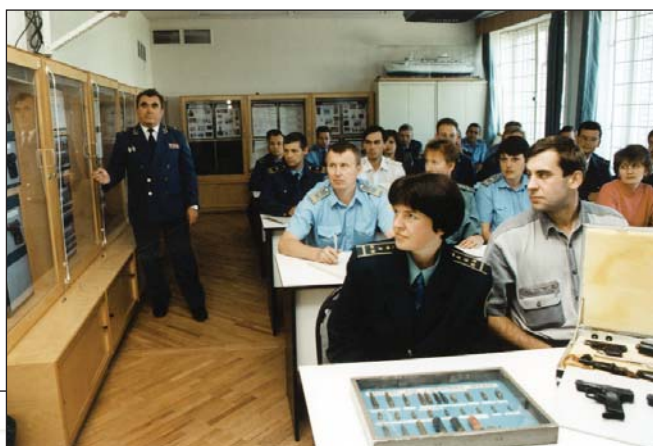
Учебный год впереди