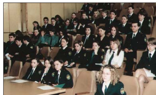
На лекции в одной из аудиторий академии