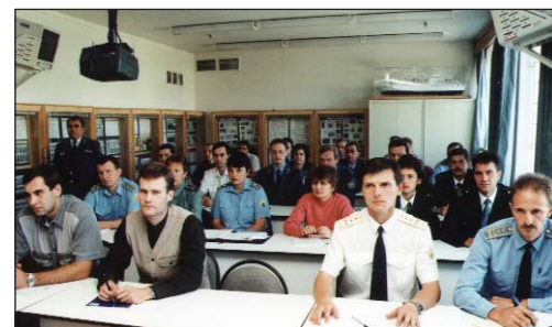
На занятиях в аудитории кафедры Организации таможенного контроля