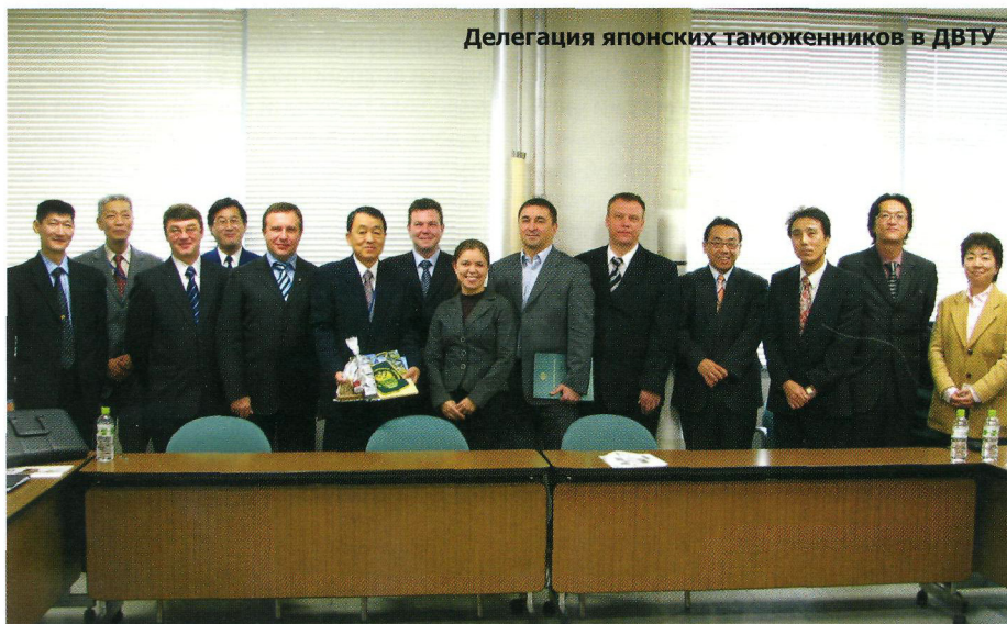
Делегация японских таможенников в ДВТУ