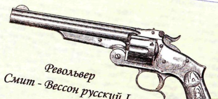
Револьвер Смит - Вессон русский