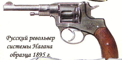
Русский револьвер системы Нагана образца 1895 г.