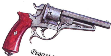
Револьвер системы Галана образца 1870 г. Бельгия - Россия