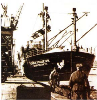
Парход «Старый большевик» во время разгрузки. Порт г. Владивосток. 1941 г.