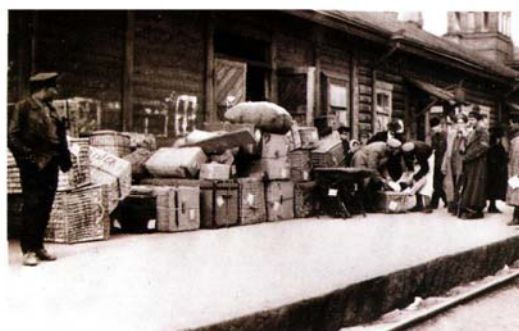
Досмотр багажа у пассажиров, едущих в Германию. ст. Орша, 1920 г.

системы управления таможенным делом. В феврале 1922 года при Совнарком РСФСР был учрежден Таможенно-тарифный комитет (ТТК), наделенный полномочиями разработки вопросов таможенно-тарифного регулирования. В феврале 1927 года в интересах развития отечественных промышленности и сельского хозяйства был утвержден Свод таможенных тарифов, более либеральный, чем тариф 1924 года.