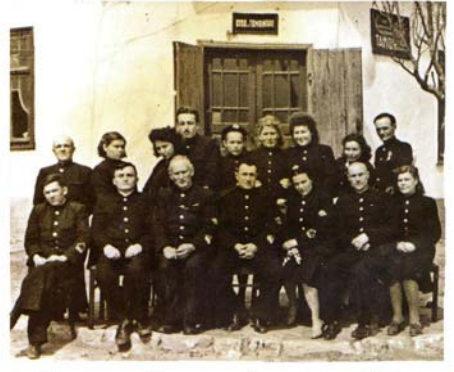
Коллектив Измайловской таможни. 1944 г.