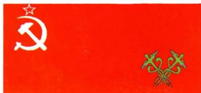
Таможенный флаг образца 1924 г.

Обложение перевозимых через границу товаров таможенной пошлиной и другими сборами с началом советского периода российской истории было передано в исключительное ведение центральной государственной власти. Одновременно управление всеми таможенными