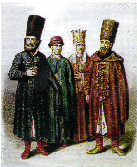
Длинные рукава одежды использовались для провоза контрабандного товара еще в XVII веке

Железная проволока, густо покрытая лаком, при досмотре оказывалась медной с позолотой, медные кубики скрывали в себе часовые механизмы, в мыле прятали жестянки с сахарином, на медицинские препараты, запрещенные к ввозу в России, наклеивали этикетки лекарств, подлежащих беспрепятственному пропуску, под хлопчатобумажную пряжу наклеивали крученый шелк и т.д. Для содействия торговле таможенные чиновники собирали сведения о торговых путях, еще не освоенных российскими купцами. Запрещалось ввозить на территорию империи сахарин, оружие, опиум.