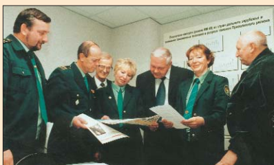
Ветераны ПТУ с интересом читают газету «Вестник»

Адрес редакции: 101000, г.Москва, а/я 139 e-mail: info@svts.ru