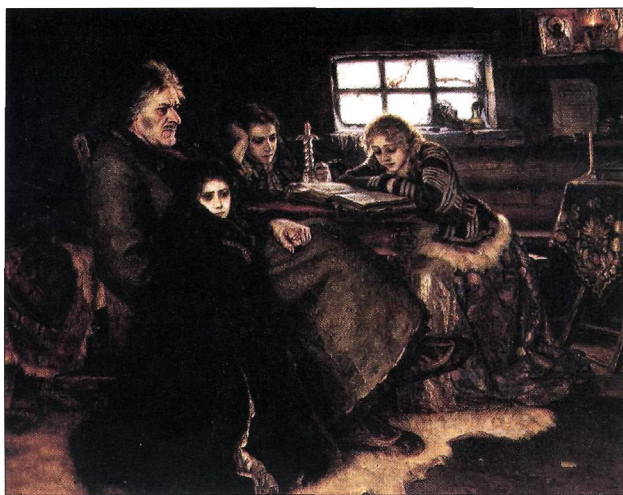
В. А. Суриков. Меньшиков в Березове. 1883. Холст, масло.

не всемогущим владыкою, Меньшиков возвысил голос – нет, не на него, Остермана, воспитателя государева, а на задумки Петра, предложенные тем, кто единственный мог бы эти задумки в жизнь воплотить, на Андрея Ивановича. А началось с того, что Меньшиков стал придираться к Остерману за то, что не так ведет воспитание государя. Русская нация, мол, не такого воспитания для царя желает. Да и чему хорошему может научить лютеранин православного отрока! Может, он вообще хочет государя от церкви отвадить? Конечно, Остерман пытался объяснить, что это совсем не так. Но Меньшикова разве остановишь: атеистом воспитателя обозвал. Тут и Андрей Иванович не выдержал, голос на светлейшего князя возвысил. И пошло-поехало.