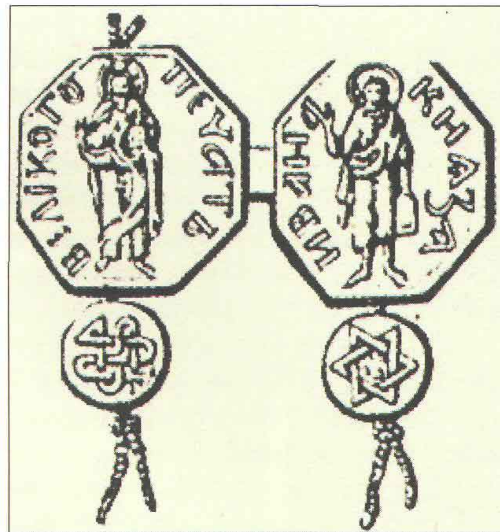
Печать великого московского князя Ивана Калиты. XIV в.

Приобретенные Калитой области имели огромное стратегическое значение для борьбы за русский Север с Новгородом. Кроме того, отсюда начинались водные пути в земли тверские и Белозерские. Наконец, леса были богаты пушным зверем. Князь Иван мог теперь посылать артели охотников для добычи «мягкого золота», которое становилось основной статьей русской торговли с восточными и западными соседями. Не забывал князь и о добыче ловчих соколов и кречетов, ценившихся в Орде.