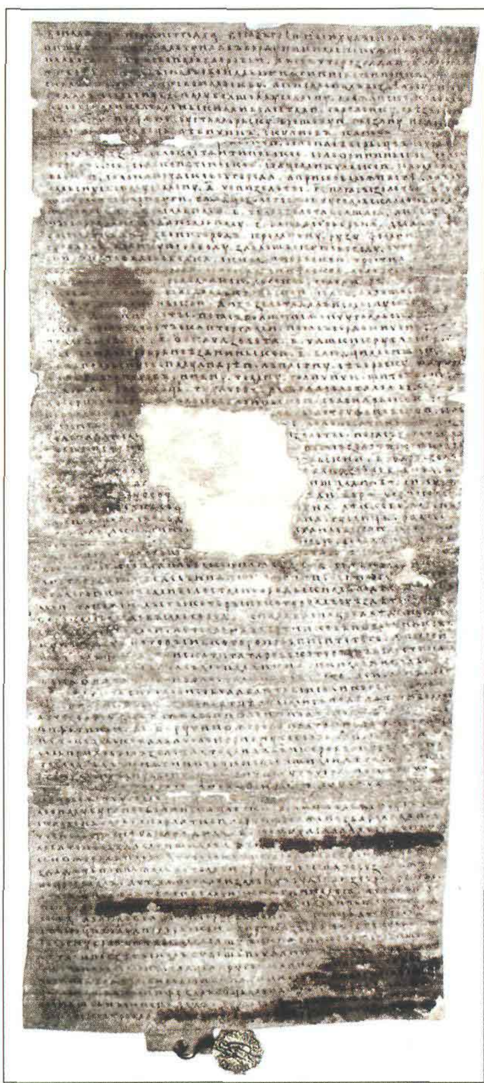
Духовная грамота великого князя Владимирского Ивана Даниловича

Но что до того Ивану Даниловичу, раз за ним – сам митрополит, возвышавшийся своим авторитетом над всеми князьями. Да и о каменном кафедральном соборе по-