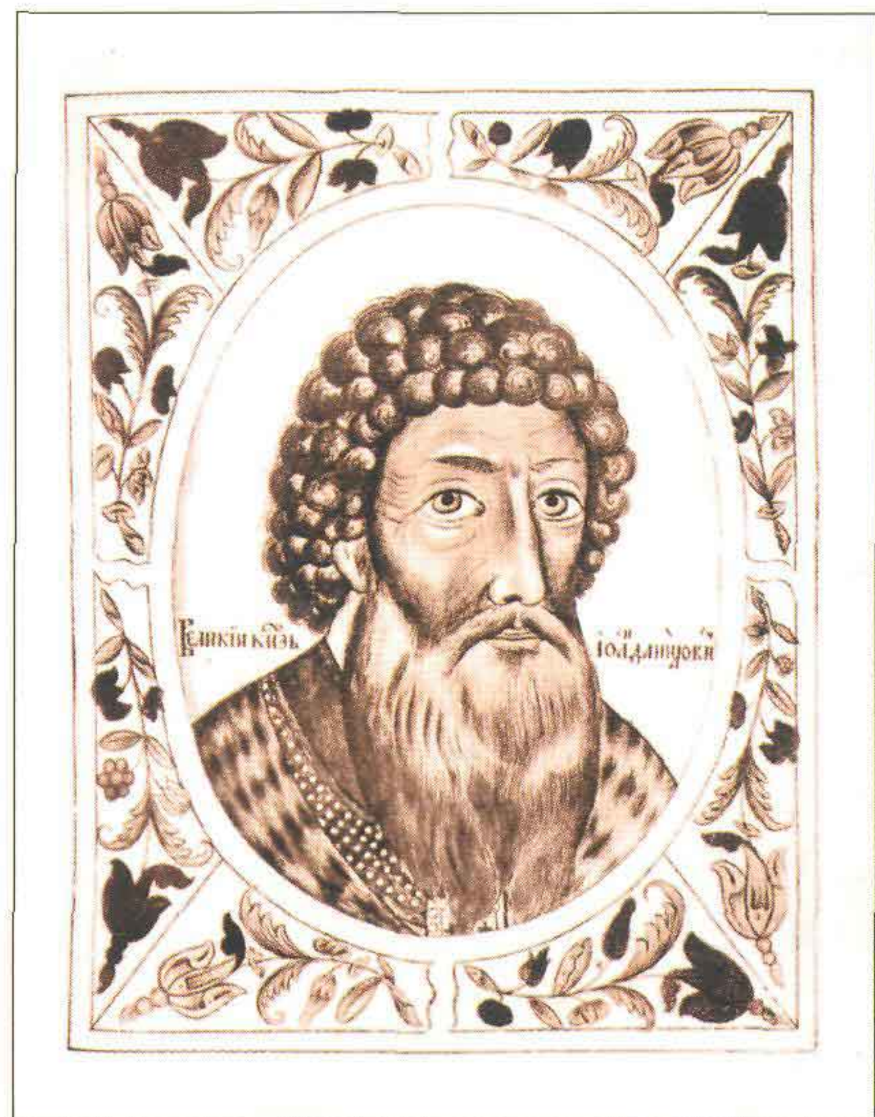
Иван I Данилович Калита. 1328–1340 гг.

Все это вызывало неизменное одобрение у любившего навещать Москву митрополита Петра. А тот, вынужденный много путешествовать по пастырским делам и имевший ярлык от хана, освобождавший его от пошлин, любил давать хорошие советы князю. «Много видел я правителей, которые в пого-