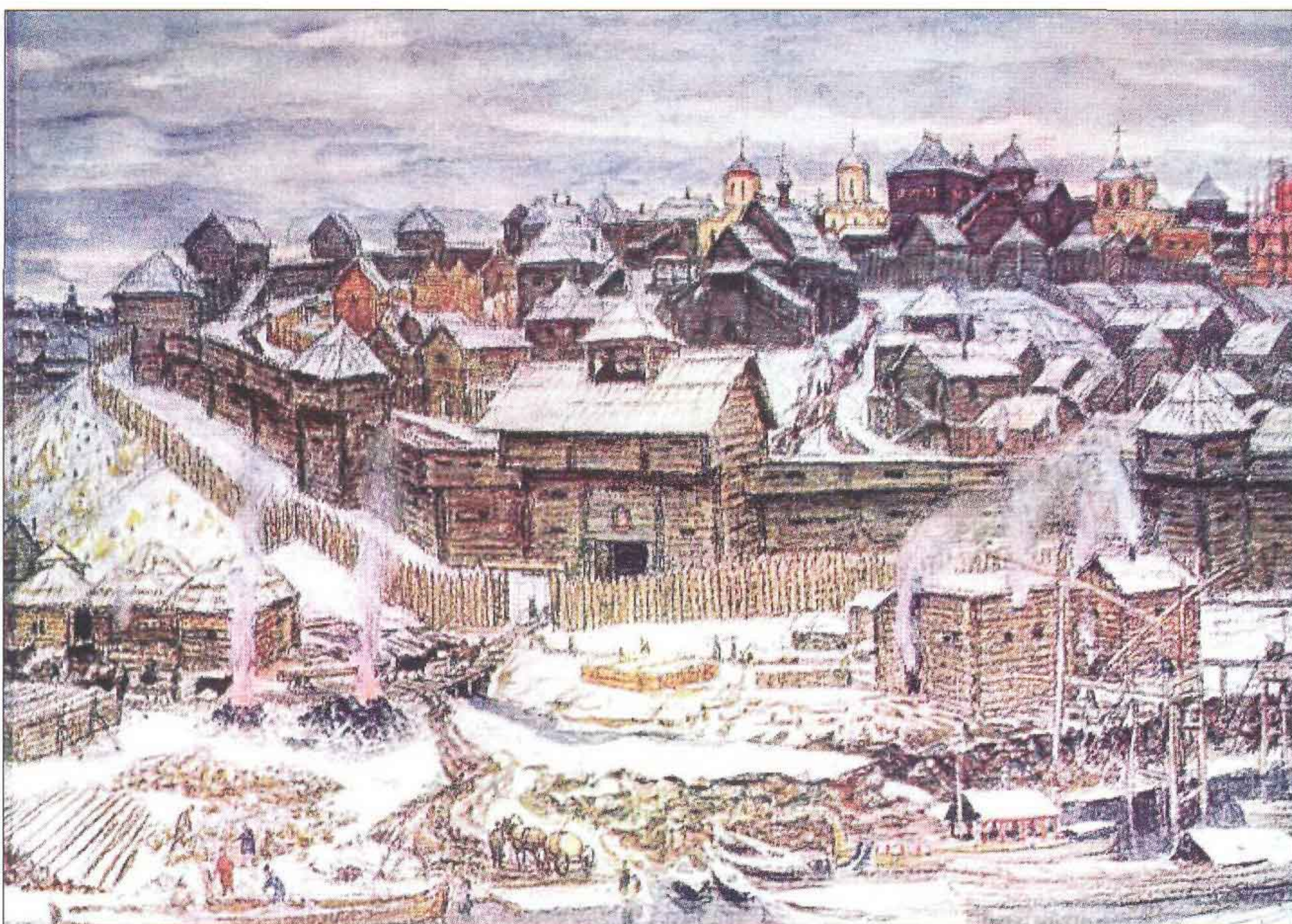
В.М.Васнецов Московский Кремль при Иване Калите

Сидящая на престоле Богоматерь с младенцем и устремленные к ней в молитвенном движении волхвы на фоне фантастических палат – являлись живописным воплощением тайной мечты князя о